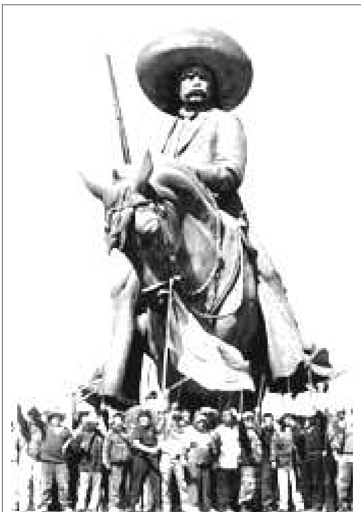
Junta de Información.