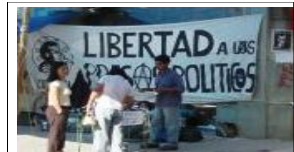
Plantón magisterial en Oaxaca. Julio del 2006.