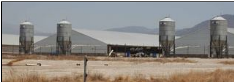
Granjas Carroll fue sancionada y expulsada de Estados Unidos por la contaminación ambiental que provocó.

Al parecer, esa contaminación causó un brote de infecciones respiratorias recientemente en La Gloria, cuando muchos habitantes enfermaron de neumonía. La infección aparentemente fue transportada por nubes de moscas de los vertederos de desechos. ★