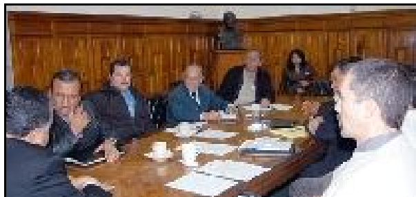
Directivos negocian en el palacio de gobierno