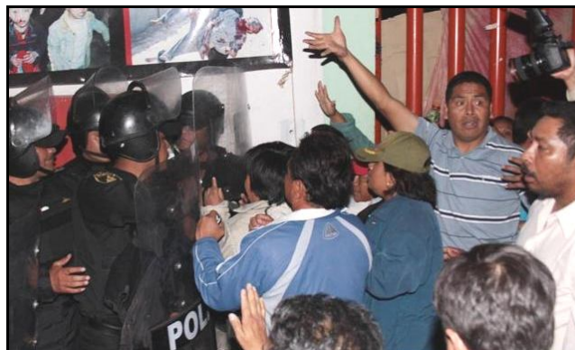
Al no mostrar una orden de desalojo, los maestros sacaron a los granaderos empujando la puerta principal.