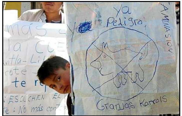
Manifestación en La Gloria, poblado de 3 mil habitantes