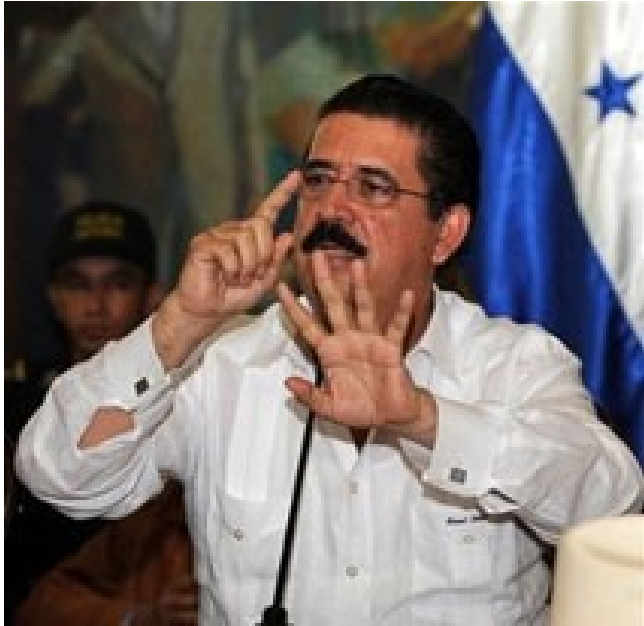
José Manuel Zelaya Rosales Presidente Constitucional de la República de Honduras